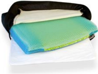
StimuLITE Zubehör HMV-Nr.: 11.99.99.0001