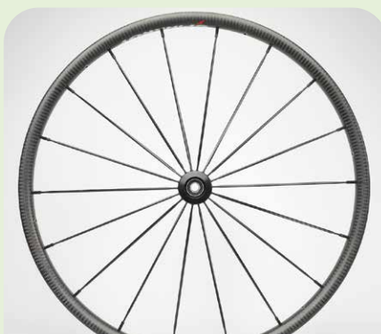
Spinergy Blade CXL18