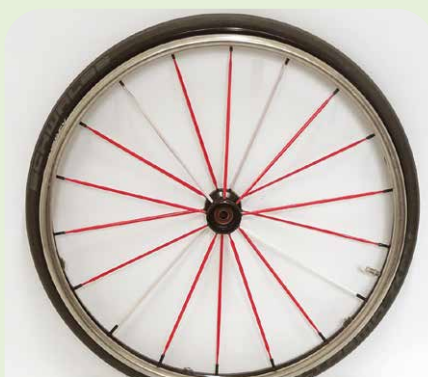
Spinergy Blade LXL18