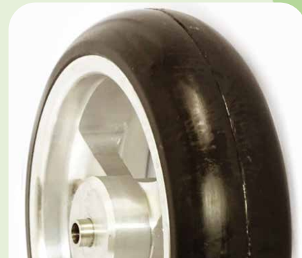
Alufelge mit Schutzkappe