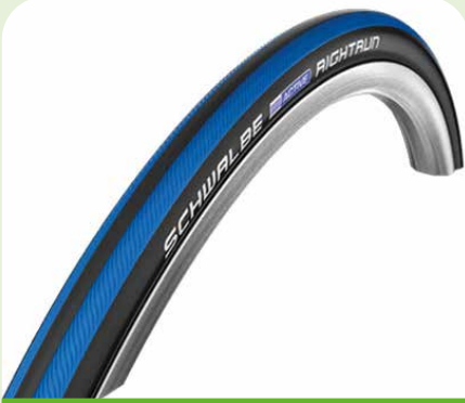
Schwalbe Right Run blau