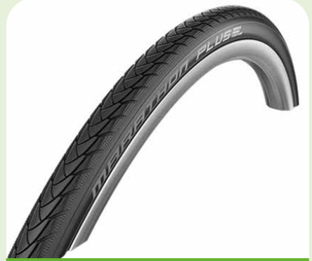
Schwalbe Marathon Plus