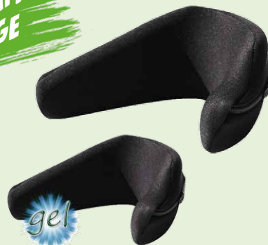
Polster linke Seite