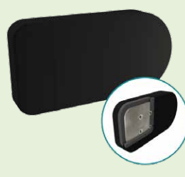
TWBADD4X86U 10,16 x 20,32cm