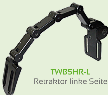
TWBSHR-L Retraktor linke Seite

Durch zusätzliche Links (TWBL-LINK) kann die Halterung individuell verlängert werden. Dies ist vor allem bei einer dickeren Rückenlehne sinnvoll.