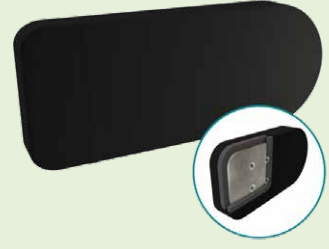
TWBADD4X10U 10,16 x 25,4cm