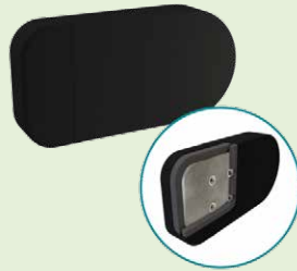
TWBADD4X6U 10,16 x 15,24cm