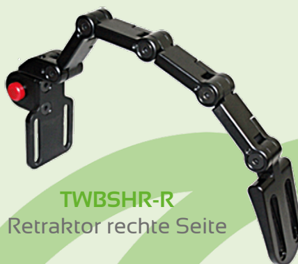
TWBSHR-R Retraktor rechte Seite