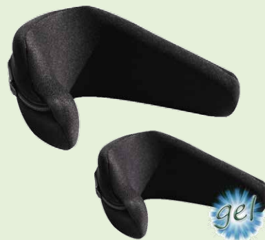
Polster rechte Seite