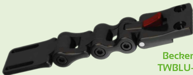
Becken TWBLU-R TWBLU-L

Sie können verwendet werden, wenn die Oberschenkel abduziert oder windschief sind und helfen auch dabei, die Hüften in eine korrekte Position zu bringen. Die Beschläge lassen sich an mehreren Stellen einstellen, um eine perfekte Passform zu gewährleisten.