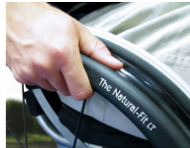
The Natural-Fit LT