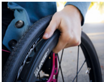
The Surge LT