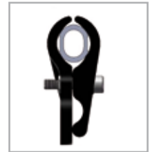
.600"/15,24 mm Ovalrohr