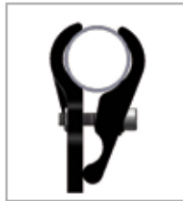
1"/25,4 mm Rundrohr