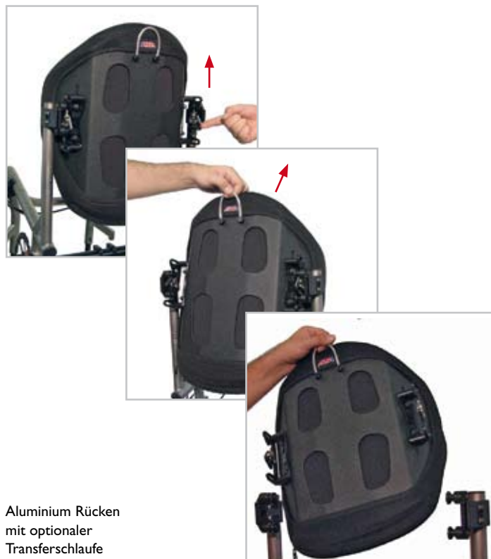
Aluminium Rücken mit optionaler Transferschleufe

Zusätzlich bietet ADI verschiedene Montagemöglichkeiten, je nachdem, ob der Rücken fest montiert (2-Point-Fixed) oder abnehmbar (Schnellverschluss) sein soll. Oftmals ist bei einem faltbaren Rollstuhl das Problem, dass mit der Montage eines festen Rückensystems der Rollstuhl nicht mehr zu falten ist, d. h. ein Transport erheblich erschwert wird, oder aufwändig ab- und wiederangebaut werden muss.