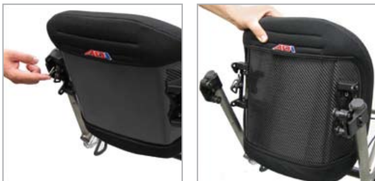
Einhandbedienung, Entriegelungshebel hochklappen und Rücken entfernen.

Dennoch ist es möglich, den Rücken in der Tiefe, der Breite und dem Winkel einzustellen und somit ein optimales Sitzgefühl zu erreichen.