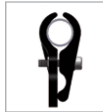
.750"/19,05 mm Rundrohr